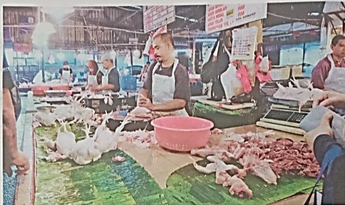
KERAJAAN menghentikan eksport ayam kerana mengutamakan bekalan untuk rakyat. — GAMBAR HIASAN