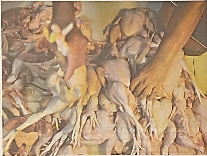
BEKALAN ayam mentah sukar diperolehi menyebabkan rata-rata peniaga menjual ayam pada harga sekitar RM11 hingga RM13 sekilogram ketika tinjauan di Pasar Chahang Tiga, Kuala Terengganu.

"Katakan contoh sebelum ini untung untuk seekor ayam ialah RM2, apa salahnya dalam situasi sukar ini mereka ambil untung RM1 namun konsisten untuk ternak ayam secara berpanjangan dan jangan ada percuturan harga," katanya.