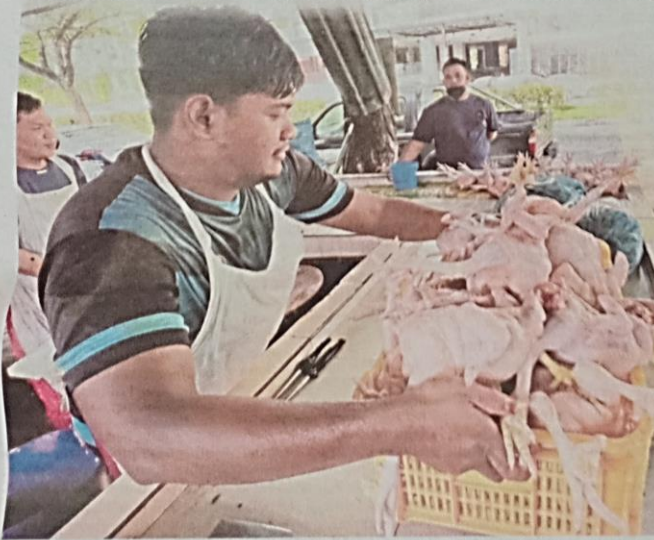
PENIAGA menyediakan tempahan dari pelanggan ketika tinjauan bekalan ayam di kedai runcit sekitar Kuala Lumpur berikutan penutupan kilang ayam dengan kebanyakan peniaga diberikan ayam dalam kuantiti kurang daripada biasa untuk jualan harian.

Menurutnya lagi, Kementerian Pemodenan Pertanian dan Pembangunan Wilayah Sarawak kini merancang untuk menswastakan Stesen Ternakan Meragang di Lawas bagi pengeluaran baka kerbau berkualiti.