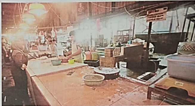
Peniaga memotong ayam yang dipesan pembeli di Pasar Datuk Keramat, Kuala Lumpur, semalam.

Katanya, harga yang diterima peruncit kadangkala melebihi harga yang ditetapkan kerajaan dan pihak yang bertanggungjawab perlu menyasat, sebelum mengenakan tindakan kepada peruncit dan peniaga.