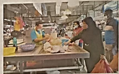
KEBANYAKAN peniaga hanya mendapat kurang separuh tempahan ayam dari pembekal di Pasar Awam Larkin.

"Manakala pasar basah atau awam pula, Pasar Awam Kuala Klawang dikesan tidak mempunyai bekalan ayam," katanya semalam.