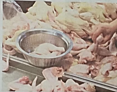
PELANGGAN memilih potongan ayam yang dijual di sebuah gerai ayam segar di Pasar Besar Seremban.

Katanya, masalah ini memberikan kesan kepada bekalan ayam di pasaran dan di kawasan tertentu.