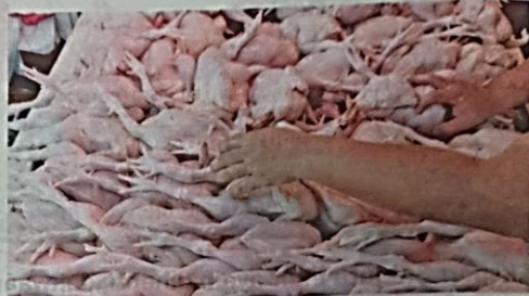
Kerajaan menghentikan eksport 3.6 juta ekor ayam sebulan bermula 1 Jun ini bagi menjamin bekalan untuk rakyat negara ini.