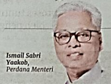
Ismail Sabri Yaakob, Perdana Menteri

Kerajaan kesal dan kecewa terhadap tindakan beberapa syarikat menghentikan bekalan ayam sehingga berlakunya peningkatan harga dan kekurangan bekalan di pasaran