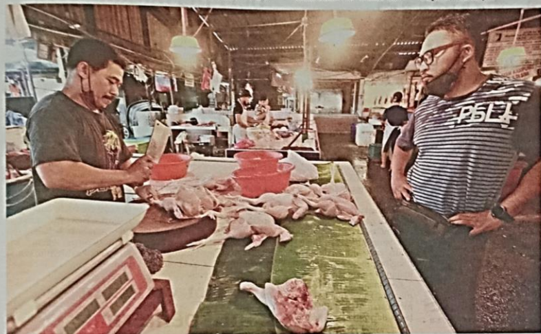
SEORANG peniaga menyiapkan ayam yang dipesan oleh restoran di Pasar Datuk Keramat, Kuala Lumpur.

"Bekalan ayam di Selangor sebelum ini memang tidak mencukupi, memang kami import. Hanya 35 hingga 40 peratus ayam tempatan yang selebihnya memang import," katanya.