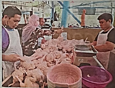
Bekalan ayam mentah sukar diperolehi menyebabkan rata-rata peniaga menaikkan harga runcit ayam.

ga ayam ditentukan sendiri oleh pasaran.